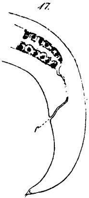
17 Hinterende des Weibchens von Enoplus cirrhatus .