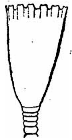
Fig. 2. — Hydrothèque de Campanularia gelatinosa (PALLAS). Gr. : 56.

Chez le Campanularia gelatinosa , le bord est différent: les dents ont la forme de créneaux légèrement excavés à leur sommet (fig. 2), il existe aussi de faibles lignes longitudinales, mais il n'y a pas trace de ces dents si particulières, formant une lame radiale interne, caractéristiques de l' Obelia spinulosa .