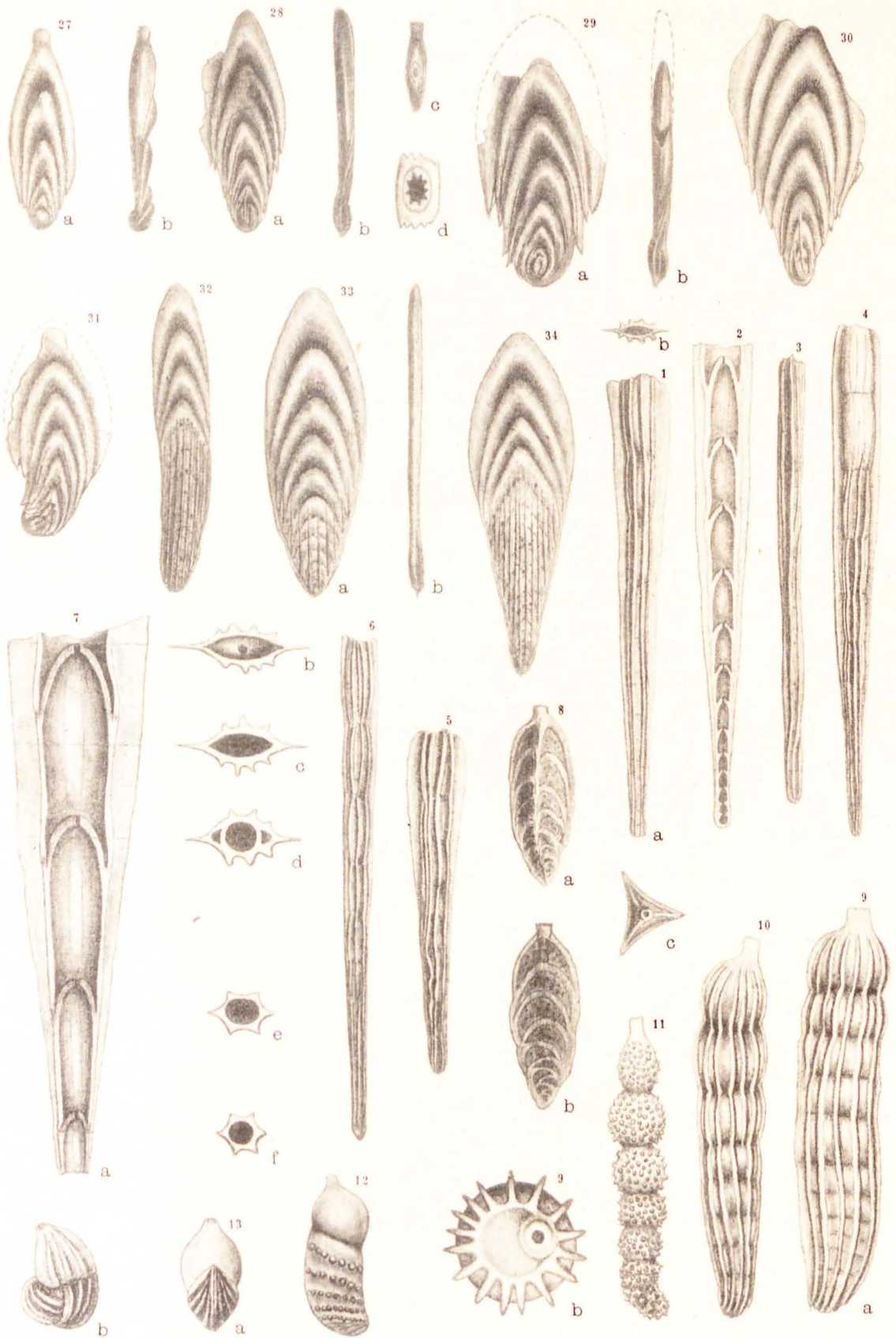
A. ed O. SILVESTRI dis. dal vero.