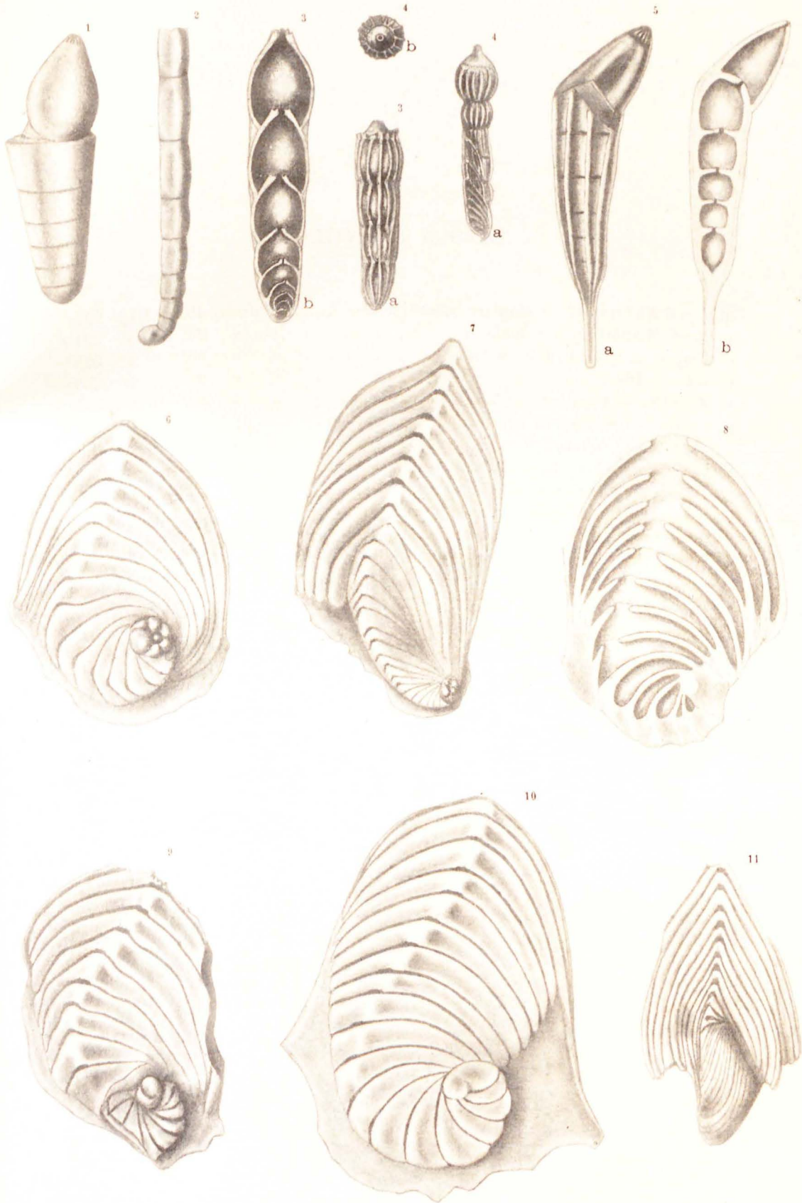
A. SILVESTRI dis. dal vero.