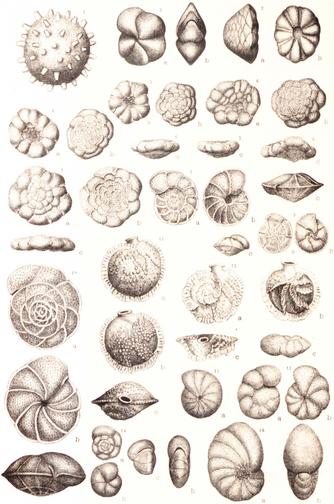
A. SILVESTRI dis. dal vero.