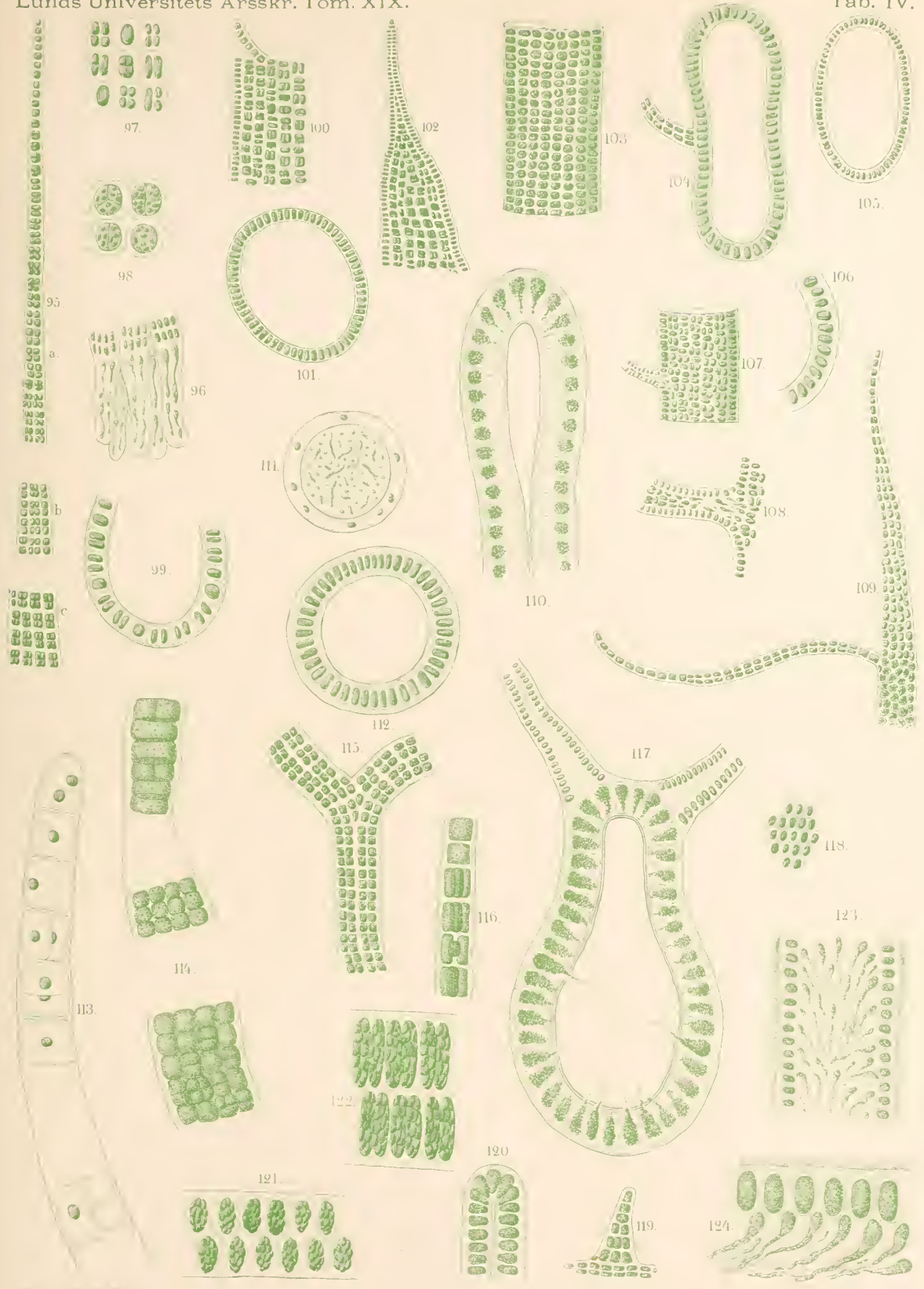
Hea fulvescens Fig. 95—99. Enteromorpha arctica Fig. 100—102. Ent. prolifera . Fig. 103—104. Ent. radiata Fig. 105—108. Ent. intestinalis Fig. 109. Ent. linza Fig. 110—112. Ent. percursa Fig. 113—116. Ent. ramulosa Fig. 117—118. Ulva rigida Fig. 119—122. Letterstedtia petiolata Fig. 123—124.