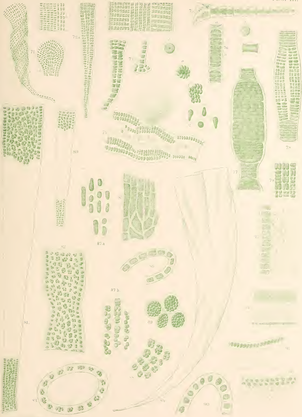
Prasiola cornucopiae Fig. 71—74. Pr. calophylla Fig. 75. Pr. Auvialis Fig. 76—79. Monostroma Greenlandicum Fig. 80—83. M. Vahlil Fig. 84—89. M. lactuca Fig. 90. Clavaria splendens Fig. 91—92. C. Blyttii Fig. 93—94.