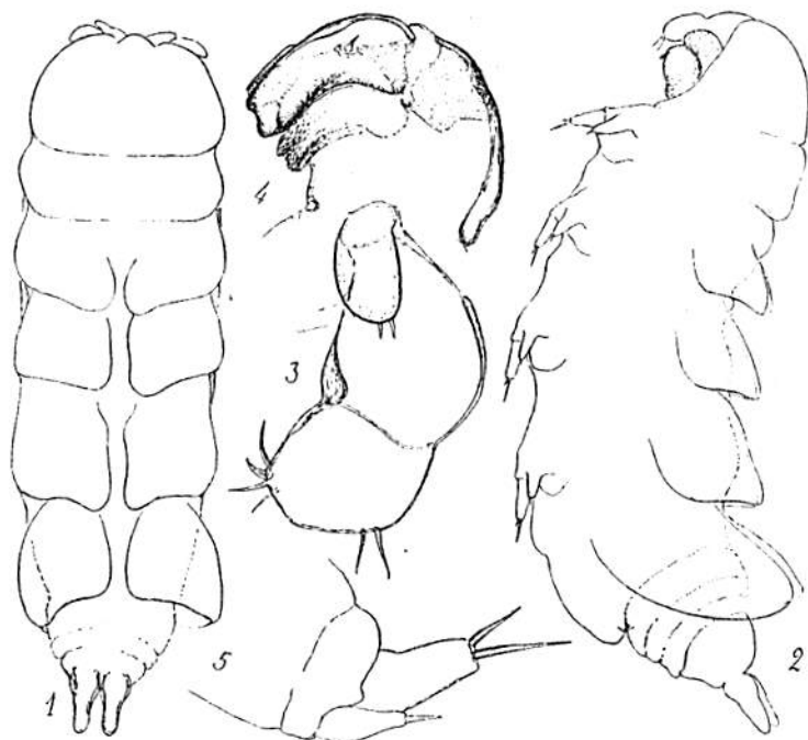
Enterocola pterophora . — 1, femelle adulte vue dorsalement; 2, femelle adulte vue latéralement; 3, antenne et antenne gauches (face antérieure) dans leurs rapports; 4, seconde maxille gauche (face postérieure); 5, premier pério-pode gauche (face postérieure).

ANTENNES biarticulées, en lames une fois plus longues que