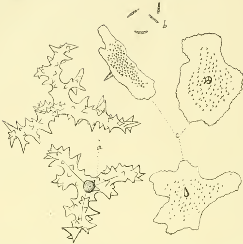
Spicules de Kaliapsis permollis . — a. Desmas; b. Microstrongyles; c. Discotriaenes.

courte ( 37 \mu environ), tandis que la face externe est chargée de petites éminences papilliformes de 1 \frac{1}{2} à 2 \mu de hauteur.