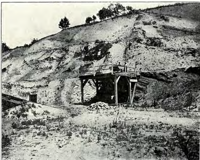
Fig. 1. Mittlere Partie des Aufschlusses der Windschen Ziegelei im Sommer 1911.

Der untere Teil des Aufschlusses besteht vorwiegend aus gelbem und weiter oben aus blaugrauem Ton, dem sich nur hie und da dünnere, feinkörnige Sandschichten einschieben. Die eine